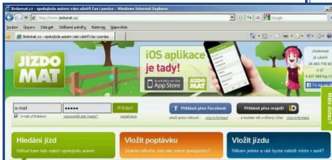
veřejný server pro spolujízdu